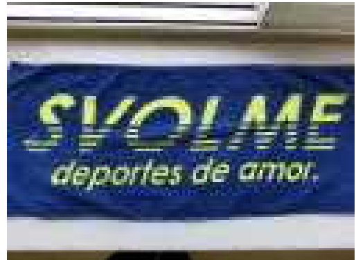
②タオル（日にち・会場不明）